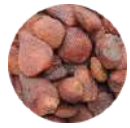
セルビア産 ストロベリー