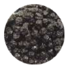
カナダ産 ワイルドブルーベリー オイルコート