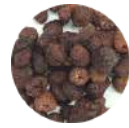
セルビア産 ラズベリー